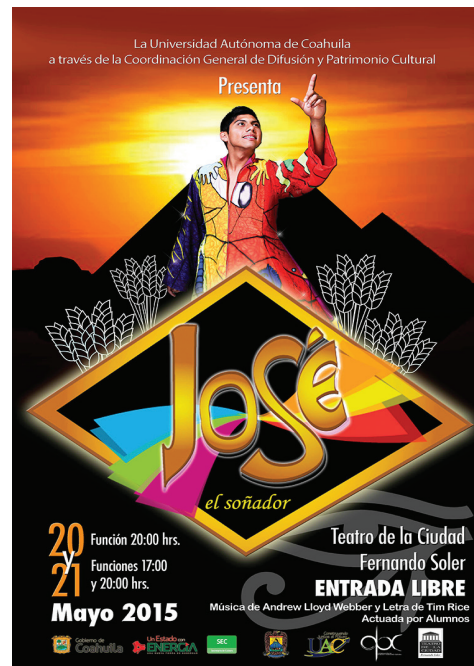
Figura 6. Invitación al musical José el soñador, 2015.

Por otro lado, respecto a los elementos y material para una estrategia de promoción, el 40 % consideró el empleo del logotipo como uno de los elementos importantes en la difusión de toda comedia musical; mientras que un 20 % expresó que el diseño del boleto es sustancial y, un 15 % comentó que el cartel es lo más importante.