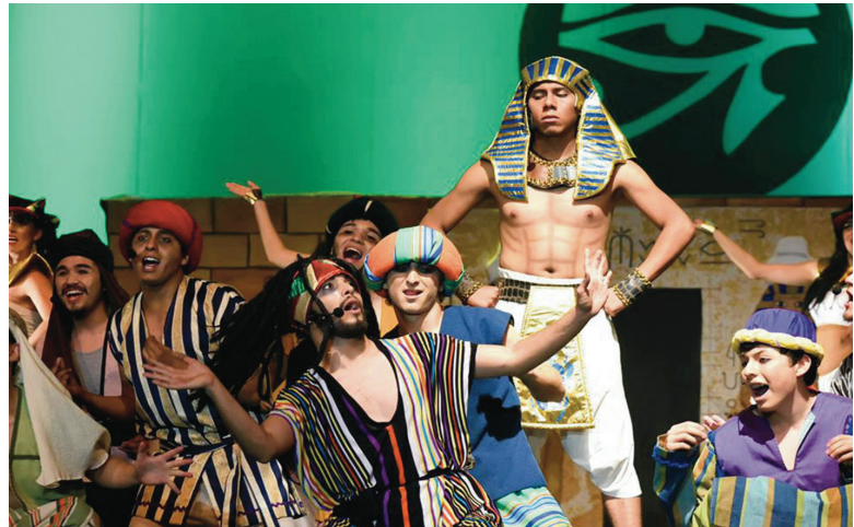
Figura 7. Escena del musical José el soñador, 2015.

Tomando en cuenta los planteamientos hechos por Laing (1992), un 35 % de los sujetos de estudio consideró un promedio de cinco horas para desarrollar el concepto gráfico; un 25 % estimó necesitar hasta una semana para su realización. En cuanto al tiempo destinado a la ejecución de la propuesta gráfica: un 70 % valoró cerca de cinco horas, esto sin contar la búsqueda en internet de trabajos similares, además del tiempo para realizar el trabajo de bocetaje para elegir la solución final. Por lo que respecta al trabajo requerido en desarrollar un concepto y diseño gráfico, más del 40 % expresó la necesidad de realizar una cita previa con los actores que interpretan un personaje, a fin de captar la esencia de la obra. En tanto, un 50 % opinó que se requiere como mínimo un mes, pues se debe acudir a un ensayo y lograr captar con ello, los elementos más importantes de la puesta en escena. Y un 40 % mencionó que tomaría en cuenta el trabajo hecho con la misma temática en alguna otra parte del mundo (ver figuras 7 y 8).