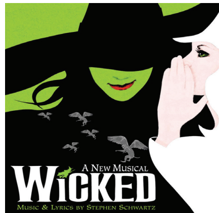
Figura 3. Cartel del musical Wicked en Broadway, 2013.

Dentro de las tres temáticas exploradas en esta investigación, uno de los apartados buscó conocer los factores que influyeron en los estudiantes para asistir a alguna presentación de comedia musical. La respuesta de estos fue generalizada, argumentaron la difusión en los medios digitales, la manera rápida y sencilla. Estos medios les posibilitaron compartir esta clase de eventos con otras personas, intercambiando comentarios, audios, videos e imágenes. En este sentido, manifestaron que les agradaría ver la presentación de la obra Wicked en la ciudad, e informarse de su difusión a través de las redes sociales y demás medios digitales (ver figura 3).