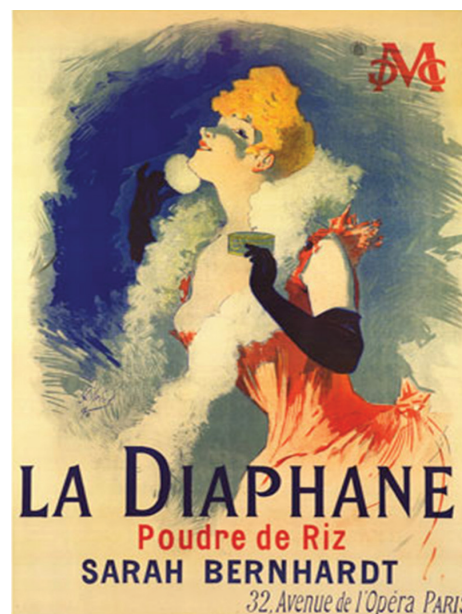
Figura 5. Cartel La Diaphane de Jules Chéret, 1867.

Otro de los elementos de un mensaje gráfico es la fotografía y la ilustración. Respecto a estas, un 80 % de la población de estudio opinó que la fotografía es el elemento con mayor impacto, por encima del uso de texto. El estudio dio a conocer que para estos la fotografía debía tener mayor jerarquía en la composición. Otro resultado fue que un 50 % de los estudiantes consideró que el retoque fotográfico puede ayudar a generar mayor impacto en el espectador. Estas opiniones refuerzan la idea del poder de la imagen para actuar sobre la percepción del espectador. Ejemplo de ello es, la propuesta del artista Jules Chéret en la creación del cartel para teatro del año 1867 (ver figura. 5). Cuya composición jerarquiza la ilustración, provocando un mayor impacto en el público. Esta idea contrasta con la opinión de un 30 % de los sujetos, quienes pensaron que el uso de una ilustración como elemento central en el concepto de una comedia musical tendría poco impacto.