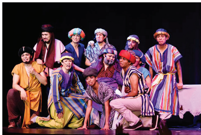
Figura 8. Escena del musical José el soñador, 2015.

Tomando en cuenta los planteamientos hechos por Laing (1992), un 35 % de los sujetos de estudio consideró un promedio de cinco horas para desarrollar el concepto gráfico; un 25 % estimó necesitar hasta una semana para su realización. En cuanto al tiempo destinado a la ejecución de la propuesta gráfica: un 70 % valoró cerca de cinco horas, esto sin contar la búsqueda en internet de trabajos similares, además del tiempo para realizar el trabajo de bocetaje para elegir la solución final. Por lo que respecta al trabajo requerido en desarrollar un concepto y diseño gráfico, más del 40 % expresó la necesidad de realizar una cita previa con los actores que interpretan un personaje, a fin de captar la esencia de la obra. En tanto, un 50 % opinó que se requiere como mínimo un mes, pues se debe acudir a un ensayo y lograr captar con ello, los elementos más importantes de la puesta en escena. Y un 40 % mencionó que tomaría en cuenta el trabajo hecho con la misma temática en alguna otra parte del mundo (ver figuras 7 y 8).