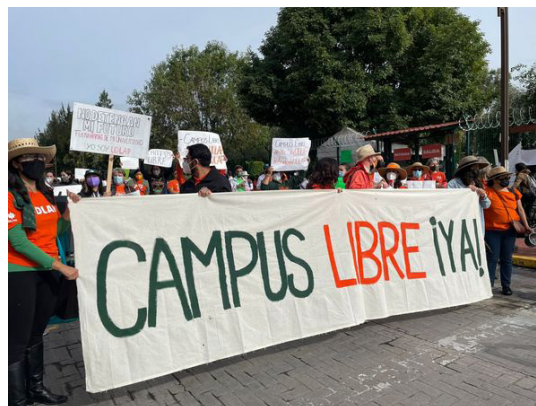
Figura 1. Las tres publicaciones con más me gusta de la UDLAP.