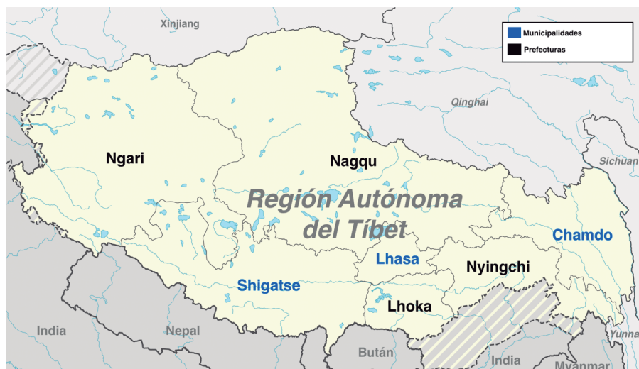
Figura 2 División administrativa de la Región Autónoma del Tíbet

Como se observa en la figura 2, en la actualidad la Región Autónoma del Tíbet se divide en tres municipalidades (“shi”) —Lhasa, Shigatse/Xigaze, y Chamdo/Qamdo— y cuatro prefecturas (“di-qu”) —Lhoka/Shannan, Nagqu, Ngari, y Nyingchi—. Las municipalidades están posicionadas en el mismo nivel que las prefecturas, aunque a las primeras se les da un peso ligeramente mayor debido al tamaño de su población y la extensión de su área urbana y distrital.