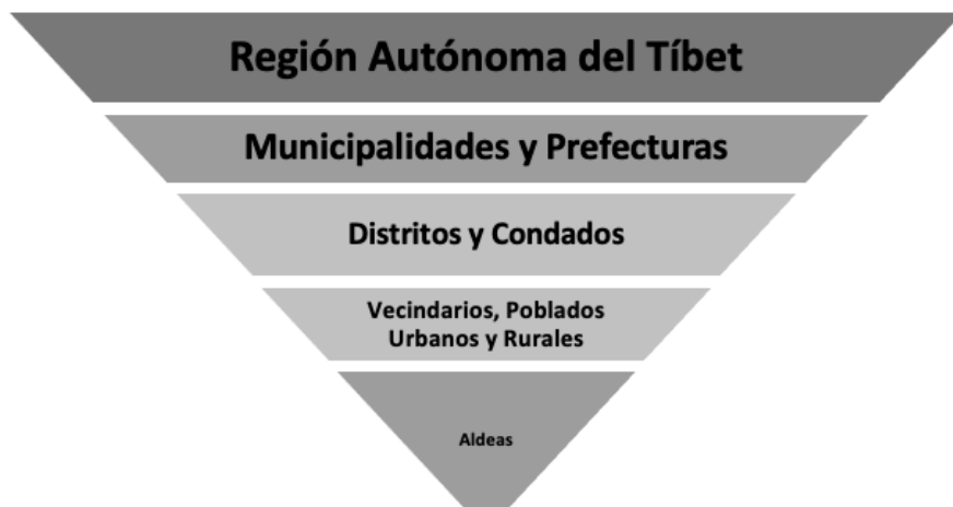
Figura 3 Ranking de la organización administrativa dentro de la región autónoma del Tíbet

(“ jie-dao ”) y poblados rurales (“ xiang ”) adyacentes junto con sus aldeas (“ cun ”). El distrito se encuentra en el mismo nivel administrativo que el condado, pero tiene una posición un poco más elevada en la jerarquía política (véase figura 3).