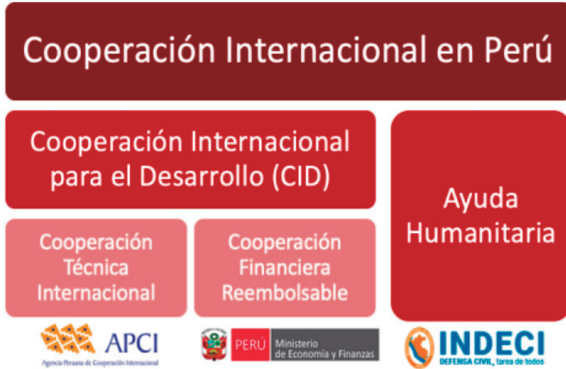
Figura 4 Gestión de la cooperación internacional en Perú