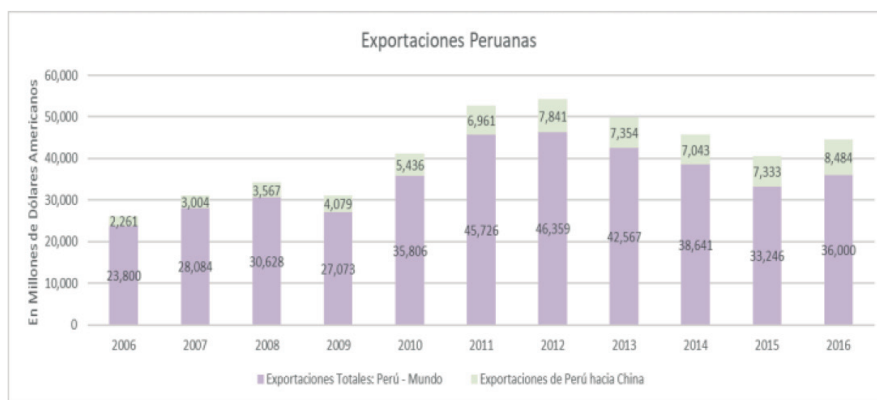
Figura 1 Exportaciones peruanas (2006-2016)

Fuente: elaboración propia con base en datos del Ministerio de Comercio Exterior y Turismo del Perú, 2017.