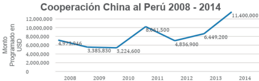
Figura 5 La cooperación China con Perú (2008-2014)

Fuente: elaboración propia con base en datos del MIPCI, SIGO 16 (“Situación y Tendencias de la Cooperación Internacional en el Perú 2011-2014”).