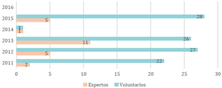
Figura 6 Número de expertos y voluntarios chinos enviados a Perú