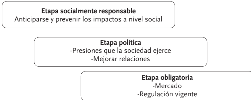
Figura 1 Etapas de la responsabilidad social de la empresa