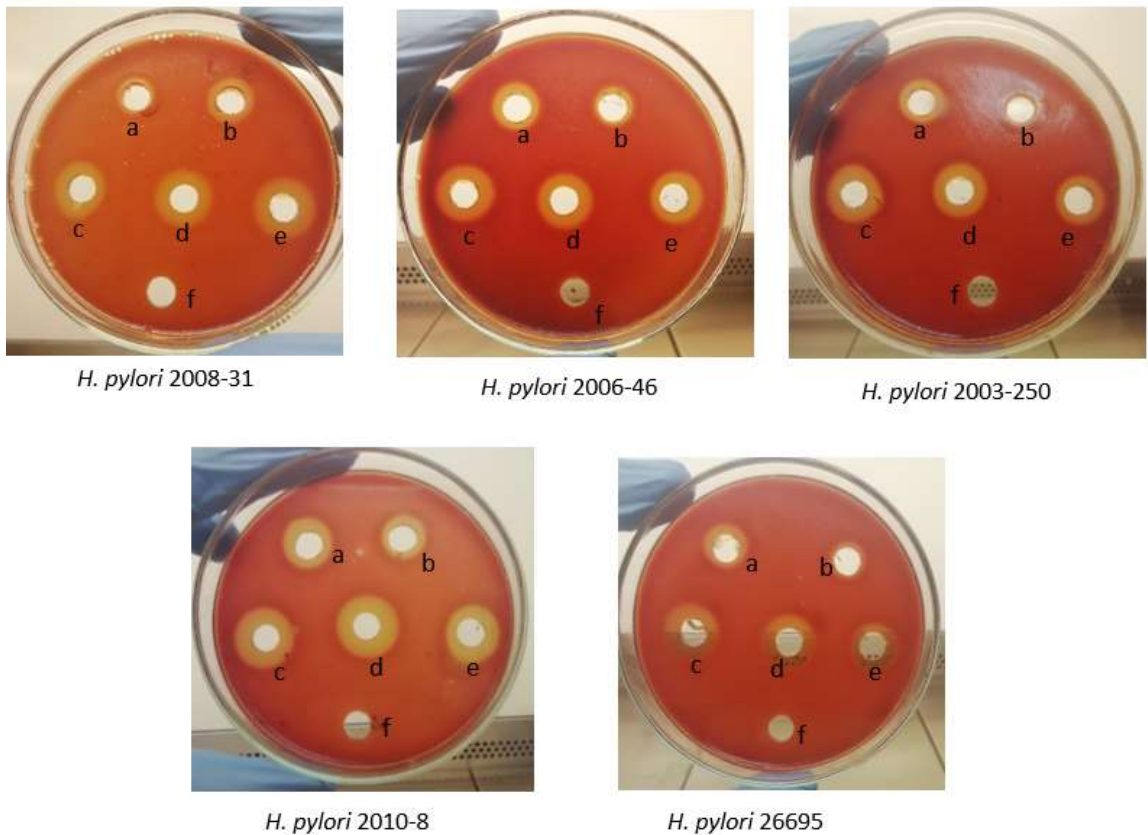
Figura 1. Tamaño del diámetro de los halos de inhibición de H. pylori con distintas concentraciones de Tween 80. Se utilizaron las concentraciones marcadas en la figura de Tween 80 para conocer el efecto que tenían sobre cepas de H. pylori . Se utilizó agua destilada como control.