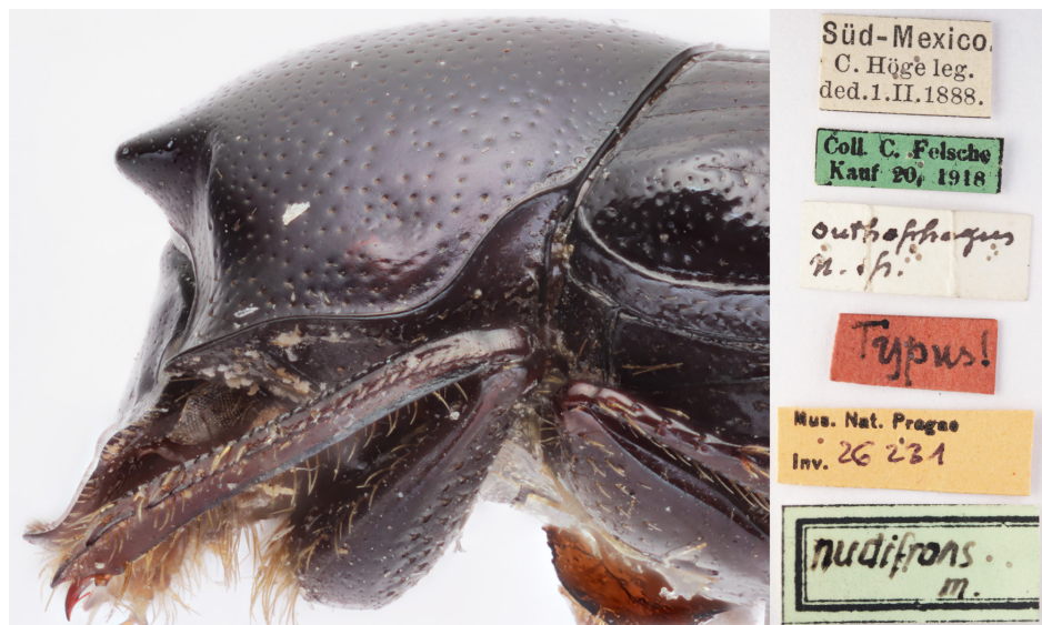
Figura 28. Holotipo de O. nudifrons , actualmente depositado en el Národní Muzeum de Praga, República Checa.