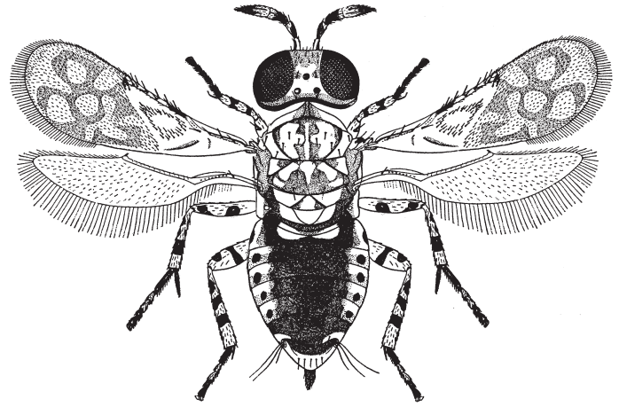
Figura 1. Marietta carnesi (Howard), hembra (según Compere, 1936, con modificaciones).