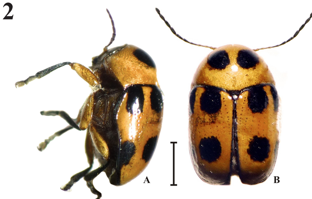
Figura 1. Sitio de recolecta de Cryptocephalus downiei en México. A) Tamaulipas; B) Ubicación del municipio de San Carlos en el estado; C) Municipio y sitio de colecta; D) Localización del nuevo registro en la Sierra de San Carlos. Elaboración con base en el Conjunto de Datos Vectoriales de la Serie Topográfica de INEGI, Escala 1 : 50,000. Figura 2. Hembra de Cryptocephalus downiei colectada en San Carlos, Tamaulipas. A) Aspecto lateral, B) Aspecto dorsal. Escala equivalente a un milímetro.