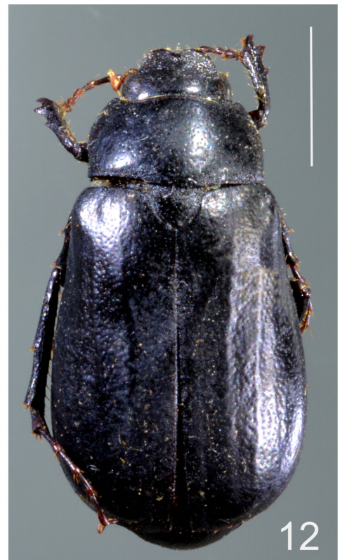
Figuras 9-12. Habitus de los machos de: Phyllophaga howdenryi , 9) dorsal. 10) lateral. Phyllophaga zunimarioi , 11) lateral. 12) dorsal. Líneas de escala 5 mm.