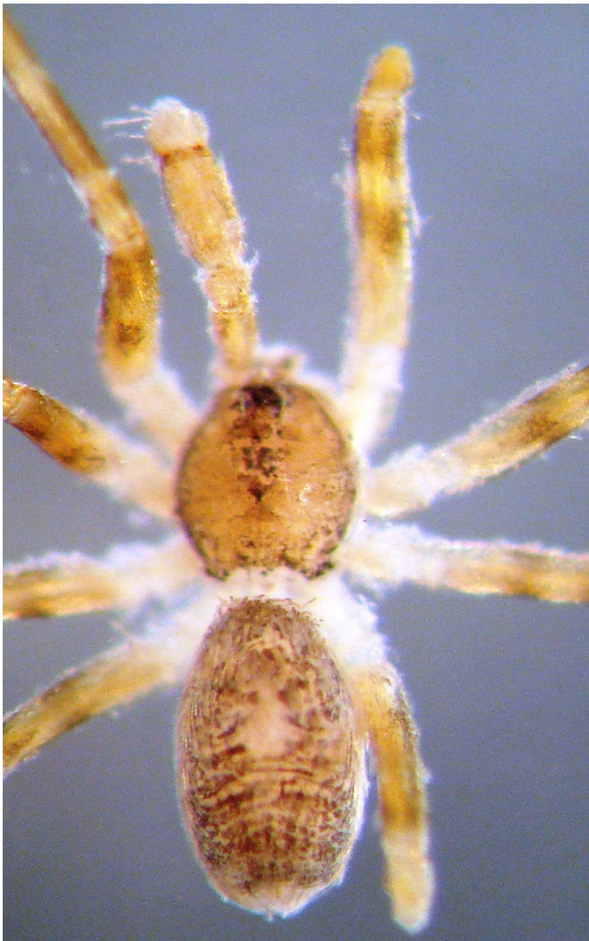
Figura 1 Vista dorsal de Filistatinella palaciosi sp. nov.