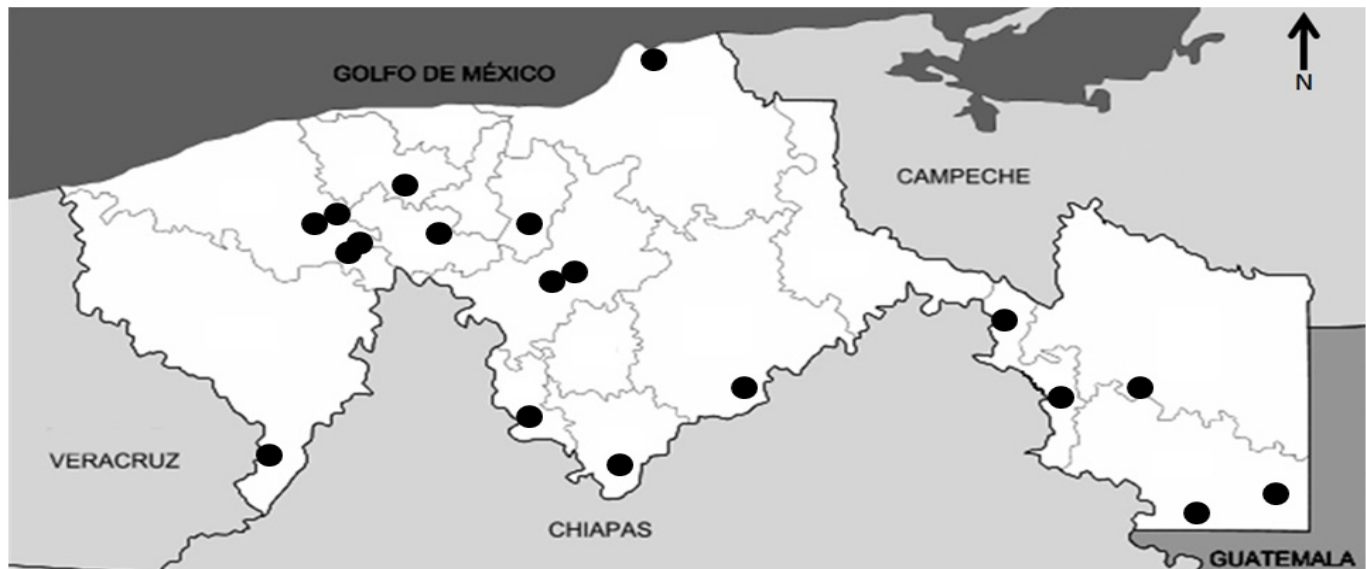
Figura 1. Sitios de muestreo y municipios de Tabasco.

Tabasco está en la región sureste de México y limita al norte con el Golfo de México, al oeste con Veracruz, al sur con Chiapas y al este con Campeche y Guatemala (Fig. 1). En esta investigación se estudia la diversidad de hormigas en 19 sitios del estado (Cuadro 1, Fig. 1). Los sitios de estudio fueron georreferenciados con un geoposicionador Garmin Geo-Explorer.