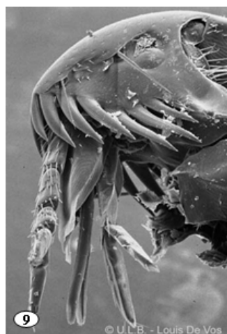
Figuras 7-8. Coenaletes caribaeus (Collembola: Coenaletidae). 7. Artejos antenales II a IV. 8. Base de la fúrcula. 9. Cabeza de una pulga de gato Ctenocephalides felis (Siphonaptera).