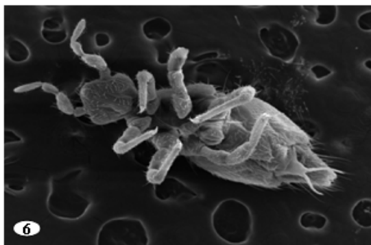
Figuras 1-6. 1. Vista ventral de Ewingia sp. (Acarida: Ewingidae). 2. Patas III y IV de Ewingia sp. (Acarida: Ewingidae). 3. Dos ejemplares de ladillas Phtirus pubis (Anoplura). 4. Vista dorsal de la cabeza de una ladilla Phtirus pubis (Anoplura). 5. Patas I a III de ladilla Phtirus pubis (Anoplura) 6. Vista ventral de Coenaletes caribaeus (Collembola: Coenaletidae).