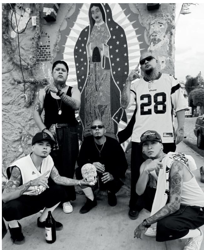
Figura 5. Raperos haciendo culto a la Virgen de Guadalupe y a la Santa Muerte

Fotografía de Julio Cesar Hernández Cuevas, 12 de julio de 2022.