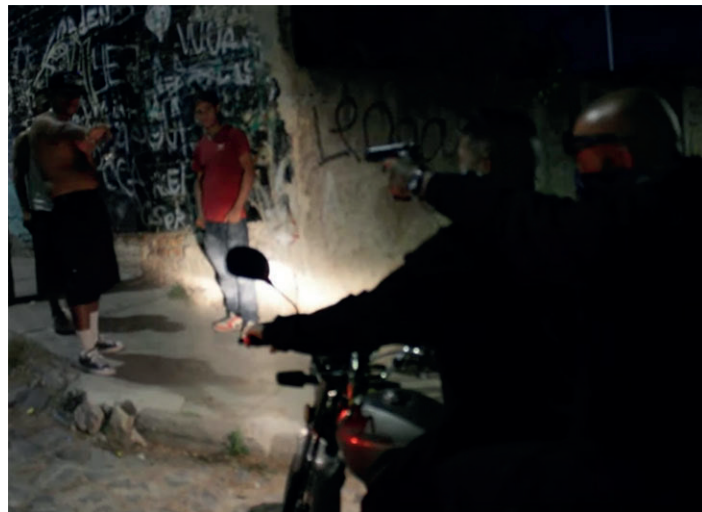
Figura 6. Escena del videoclip de los raperos