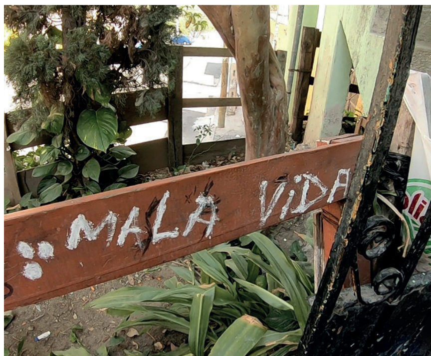
Figura 4. Frase "MALA VIDA" escrita en una tabla en la Colonia Santa Cecilia

Fotografía de Julio Cesar Hernández Cuevas, 11 de noviembre de 2021.