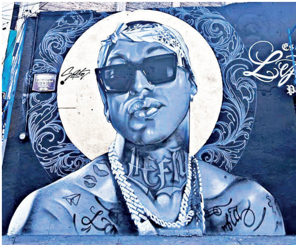
Figura 3. Mural del rapero Lefty en avenida Federalismo con cruce en la calle Independencia, zona centro

22 de septiembre de 2023.