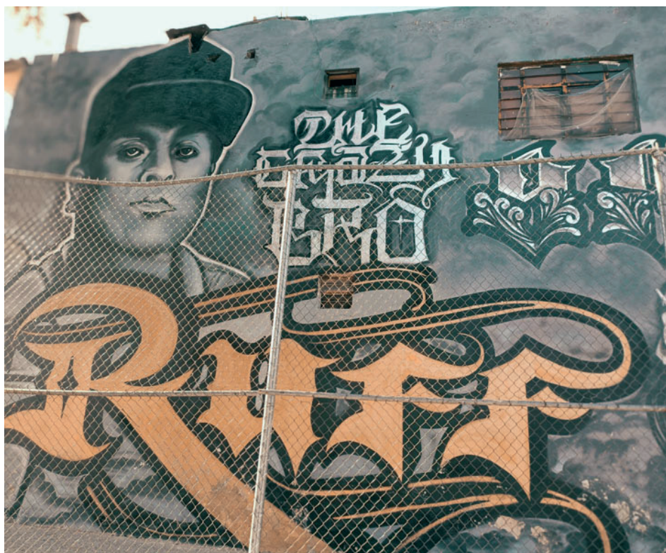
Figura 1. Mural del rapero Ruff, hermano de C-Kan, plasmado en una pared de la cancha 98

11 de octubre de 2022.