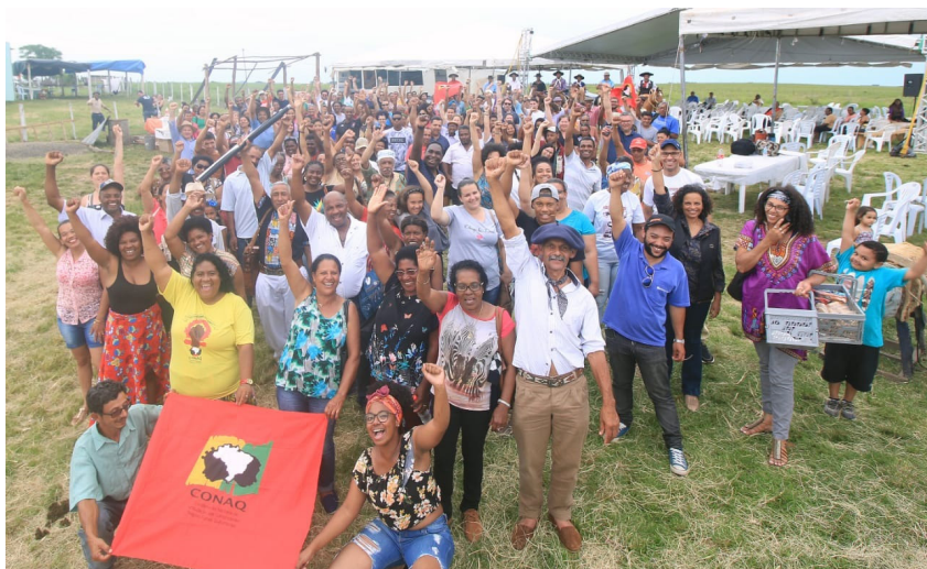
Figura 1. V Encuentro de Comunidades Quilombolas. Ibicuí da Armada, Santana do Livramento, 2019