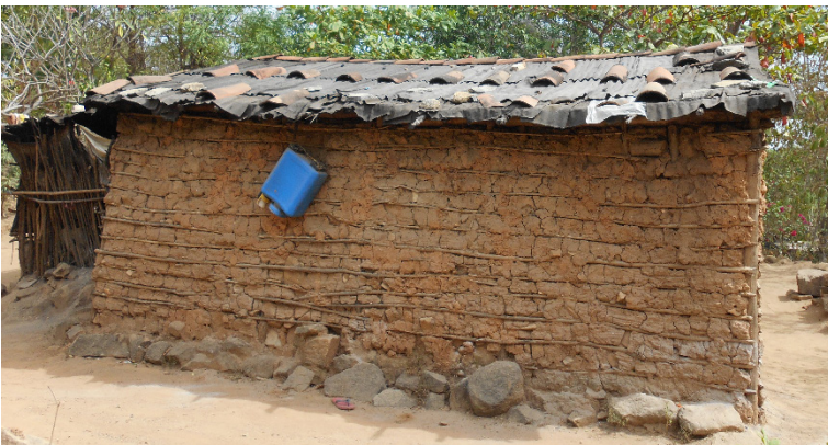
Figura 3. Casa típica con embarro, varas y piedras