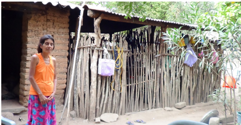
Figura 2. Doña Josefa mostrando su tradicional casa de adobe con cocina de varas

A pesar de algunas de las transformaciones que ha tenido en las diversas épocas de su historia, aún prevalece entre los mixtecos de La Raya el sentido de que la vivienda debe ser confortable de manera natural, haciendo referencia a la palma y las tejas para el techado, y los muros con piedras, varas y lodo o adobe. Para los habitantes, la comodidad de una casa es una condición imprescindible para vivir bien, koova'ayo ; sin embargo, la vivienda típica cae en desuso, por la utilización de materiales más baratos para el techado (figuras 2 y 3).