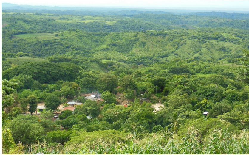
Figura 1. Vista panorámica de La Raya